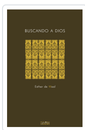
BUSCANDO A DIOS