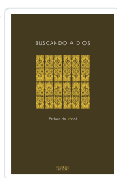
BUSCANDO A DIOS