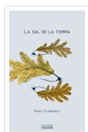
SAL DE LA TIERRA, LA (SIG) FLORENSKIJ