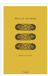
REGLA DE LOS MONJES BENITO DE NURSIA