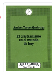
CRISTIANISMO EN EL MUNDO DE HOY nº 17 TORRES QUEIRUGA, ANDRES