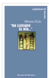
HA LLEGADO EL DIA... KALO SHLOMO