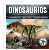
DINOSAURIOS EQUIPO EDITORIAL