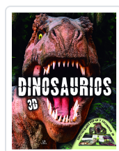
Dinosaurios 3D Equipo Editorial