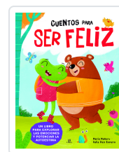
Cuentos para Ser Feliz Equipo Editorial ; Díez Romero, Dalia