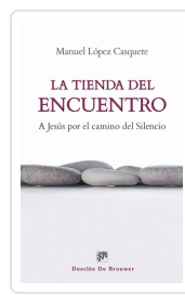
TIENDA DEL ENCUENTRO LOPEZ CASQUETE DE PRADO, MANUEL