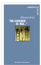
HA LLEGADO EL DIA... KALO SHLOMO