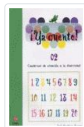
YA CUENTO. 02