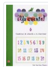
YA CUENTO. 6