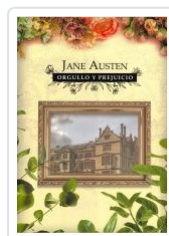
ORGULLO Y PREJUICIO AUSTEN, JANE