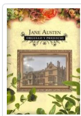
ORGULLO Y PREJUICIO AUSTEN, JANE