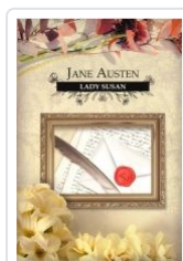
LADY SUSAN AUSTEN, JANE