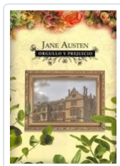
ORGULLO Y PREJUICIO AUSTEN, JANE