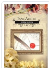
LADY SUSAN AUSTEN, JANE