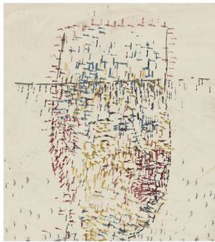
Pablo d'Ors Los contemplativos