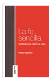
FE SENCILLA ZAMORA, PEDRO