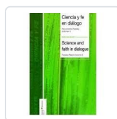
CIENCIA Y FE EN DIALOGO (I) VV.AA.