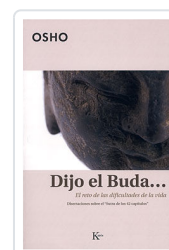
DIJO EL BUDA... OSHO