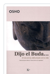
DIJO EL BUDA... OSHO