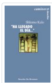
HA LLEGADO EL DIA... KALO SHLOMO