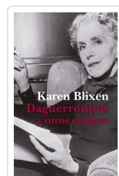
Daguerrotipos y otros ensayos Blixén, Karen