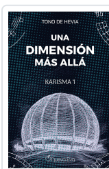
Una dimensión más allá De Hevia, Tono