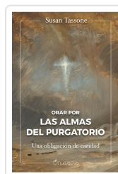
Orar por las almas del purgatorio Tassone, Susan