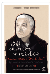
30 CUENTOS Y MEDIO MILIKI ARAGON EMILIO