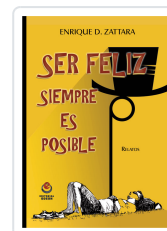
SER FELIZ SIEMPRE ES POSIBLE ZATTARA