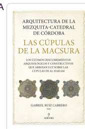
ARQUITECTURA DE LA MEZQUITA-CATEDRAL DE CORDOBA. LAS CUPULA RUIZ CABRERO, GABRIEL