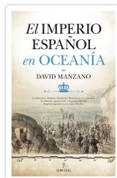
IMPERIO ESPAÑOL EN OCEANIA DAVID MANZANO COSANO