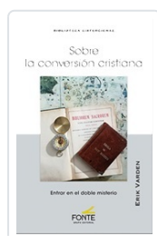
SOBRE LA CONVERSION CRISTIANA ERIK VARDEN