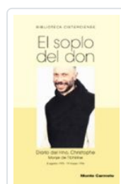
SOPLO DEL DON, EL