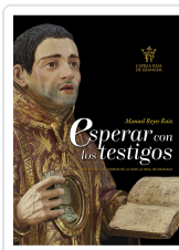
ESPERAR CON LOS TESTIGOS. RELIQUIAS CATEDRAL GRANADA REYES RUIZ, MANUEL