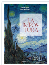
LA IMPOSTURA BERNANOS, GEORGES