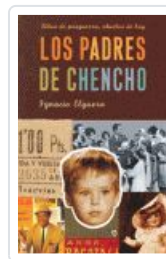
PADRES DE CHENCHO, LOS ELGUERA, IGNACIO