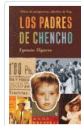
PADRES DE CHENCHO, LOS ELGUERA, IGNACIO