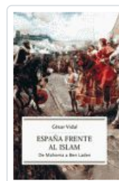
ESPAÑA FRENTE AL ISLAM VIDAL, CESAR