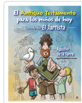
El Antiguo Testamento para los niños de hoy El Jartista El Jartista