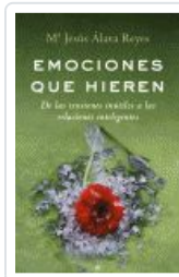
EMOCIONES QUE HIEREN