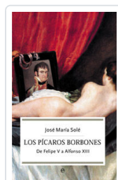
PICAROS BORBONES, LOS SOLE, JOSE MARIA