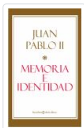
MEMORIA E IDENTIDAD JUAN PABLO II