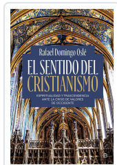
El sentido del cristianismo Domingo Osé, Rafael