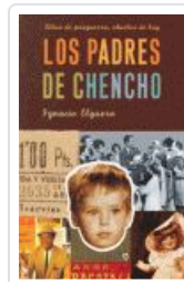
PADRES DE CHENCHO, LOS ELGUERA, IGNACIO