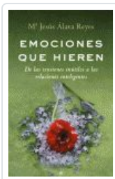
EMOCIONES QUE HIEREN