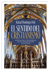
El sentido del cristianismo Domingo Osle, Rafael