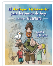
El Antiguo Testamento para los niños de hoy El Jartista El Jartista