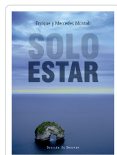
SOLO ESTAR MONTALT ALCAYDE, ENRIQUE / MONTALT ALCAY