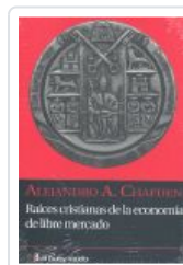
RAICES CRISTIANAS DE LA ECONOMIA DE LIBRE MERCADO CHAFUEN, ALEJANDRO A.