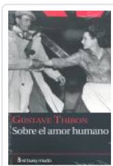
SOBRE EL AMOR HUMANO THIBON, GUSTAVE