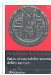
RAICES CRISTIANAS DE LA ECONOMIA DE LIBRE MERCADO CHAFUEN, ALEJANDRO A.