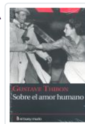
SOBRE EL AMOR HUMANO THIBON, GUSTAVE