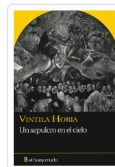
UN SEPULCRO EN EL CIELO HORIAL IUCAL, VINTILA