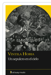
UN SEPULCRO EN EL CIELO HORIA IUCAL, VINTILA