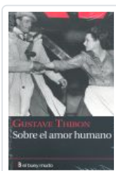
SOBRE EL AMOR HUMANO THIBON, GUSTAVE