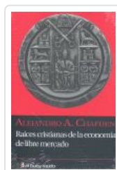
RAICES CRISTIANAS DE LA ECONOMIA DE LIBRE MERCADO CHAFUEN, ALEJANDRO A.