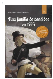
UNA FAMILIA DE BANDIDOS EN 1793 SAINTE-HÉRMINE, MARÍA