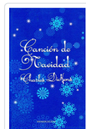
CANCION DE NAVIDAD DICKENS, CHARLES