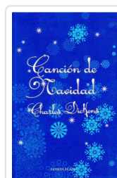
CANCION DE NAVIDAD DICKENS, CHARLES