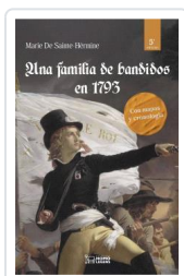
UNA FAMILIA DE BANDIDOS EN 1793 SAINTE-HÉRMINE, MARÍA