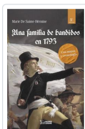
UNA FAMILIA DE BANDIDOS EN 1793 SAÏNTE-HÈRMINE, MARÍA