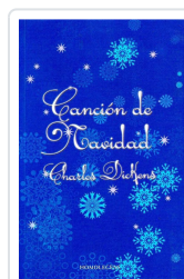
CANCION DE NAVIDAD DICKENS, CHARLES