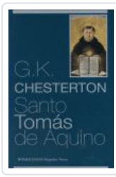
SANTO TOMAS DE AQUINO. CHESTERTON CHESTERTON, G. K.