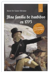
UNA FAMILIA DE BANDIDOS EN 1793 SAINTE-HÉRMINE, MARÍA