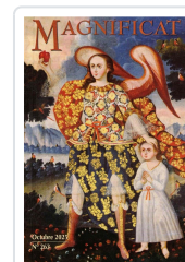
MAGNIFICAT OCTUBRE 2025 AA.VV