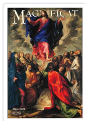
MAGNIFICAT MAYO 2026 AA.VV