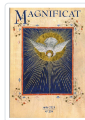
MAGNIFICAT JUNIO 2025 AA.VV