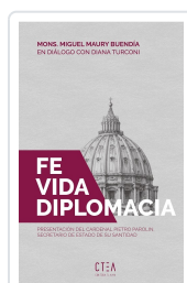
FE VIDA Y DIPLOMACIA BUENDÍA MAURY, MONS MIGUEL