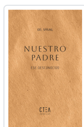
NUESTRO PADRE Sprung, Joel