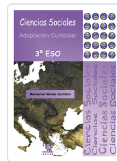
CIENCIAS SOCIALES. 3º ESO. ADAPTACION CURRICULAR MORENO CARRETERO