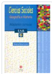
CIENCIAS SOCIALES. 1º ESO MORENO CARRETERO