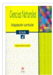
CIENCIAS NATURALES. 1º ESO. ADAPTACION CURRICULAR MORENO CARRETERO