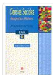
CIENCIAS SOCIALES. 1º ESO MORENO CARRETERO