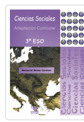
CIENCIAS SOCIALES. 3º ESO. ADAPTACION CURRICULAR MORENO CARRETERO