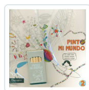
PINTO MI MUNDO 2 POTOLO BAT, MUXOTE