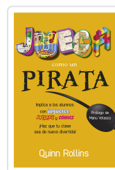
JUEGA COMO UN PIRATA ROLLINS, Q.