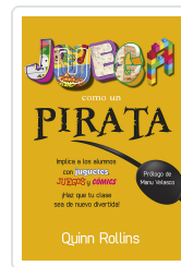
JUEGA COMO UN PIRATA ROLLINS, Q.