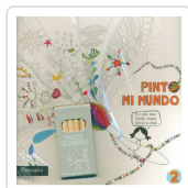
PINTO MI MUNDO 2 POTOLO BAT, MUXOTE