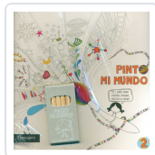
PINTO MI MUNDO 2 POTOLO BAT, MUXOTE