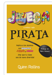
JUEGA COMO UN PIRATA ROLLINS, Q.