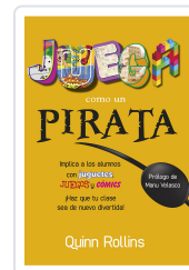
JUEGA COMO UN PIRATA ROLLINS, Q.