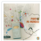
PINTO MI MUNDO 2 POTOLO BAT, MUXOTE