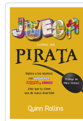
JUEGA COMO UN PIRATA ROLLINS, Q.