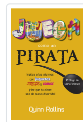
JUEGA COMO UN PIRATA ROLLINS, Q.