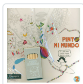
PINTO MI MUNDO 2 POTOLO BAT, MUXOTE