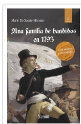
UNA FAMILIA DE BANDIDOS EN 1793 SAINTE-HÉRMINE, MARÍA