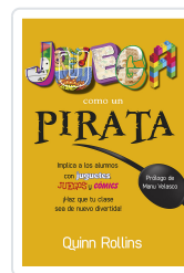
JUEGA COMO UN PIRATA ROLLINS, Q.