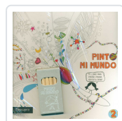
PINTO MI MUNDO 2 POTOLO BAT, MUXOTE