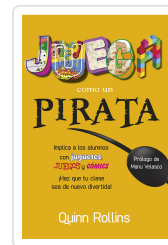
JUEGA COMO UN PIRATA ROLLINS, Q.