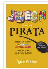
JUEGA COMO UN PIRATA ROLLINS, Q.