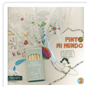
PINTO MI MUNDO 2 POTOLO BAT, MUXOTE