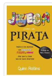
JUEGA COMO UN PIRATA ROLLINS, Q.